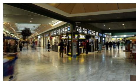
GMS (Grandes et Moyennes Surfaces)